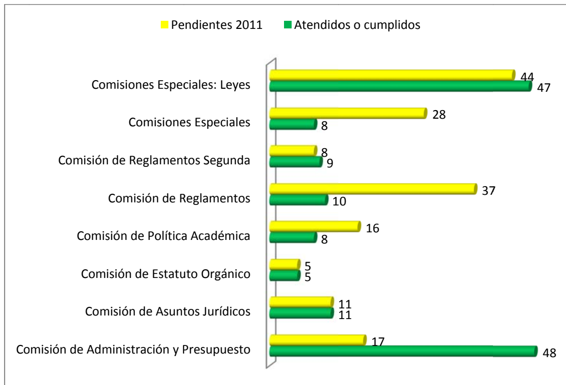
Gráfico N.º 2 Distribución por Comisión según estado del caso a setiembre de 2011